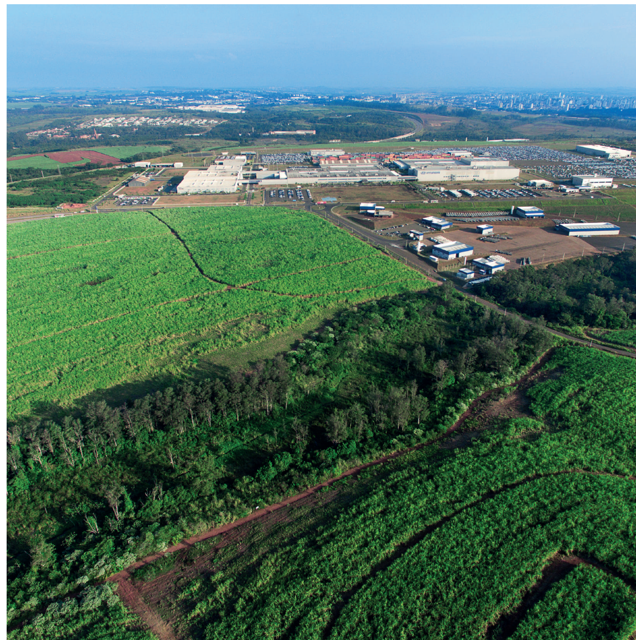
Hyundai plantó 48.000 plántulas de especies nativas cerca de la fábrica en Piracicaba y alcanzó la meta de “relleno cero”, no envía residuos a rellenos sanitarios.